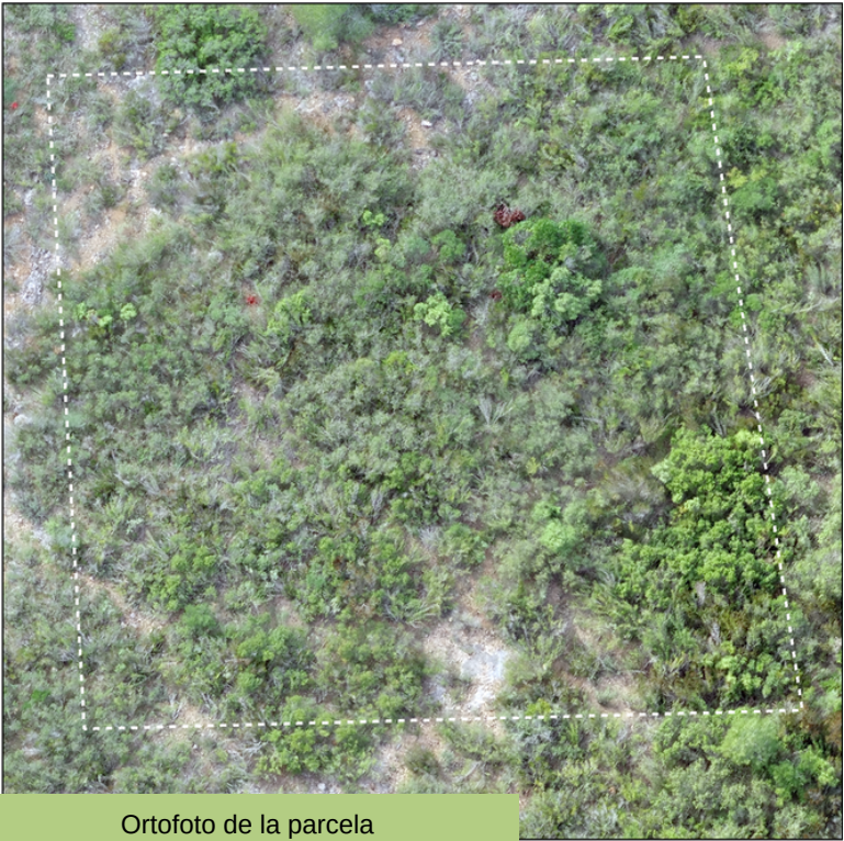
Ortofoto de la parcela