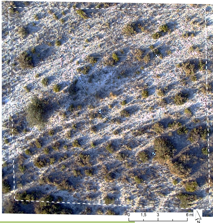
Ortofoto de la parcela