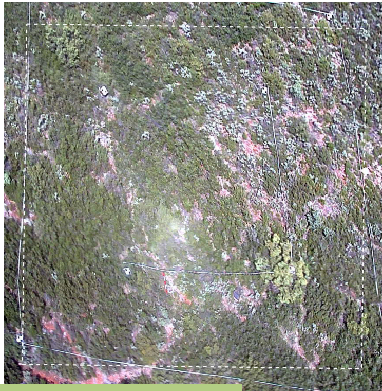
Ortofoto de la parcela