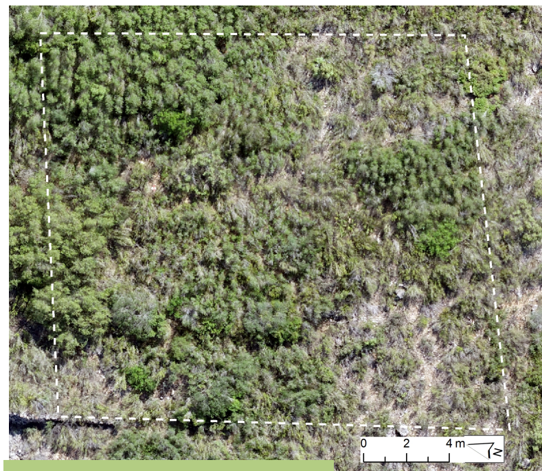
Ortofoto de la parcela