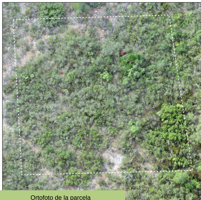
Ortofoto de la parcela