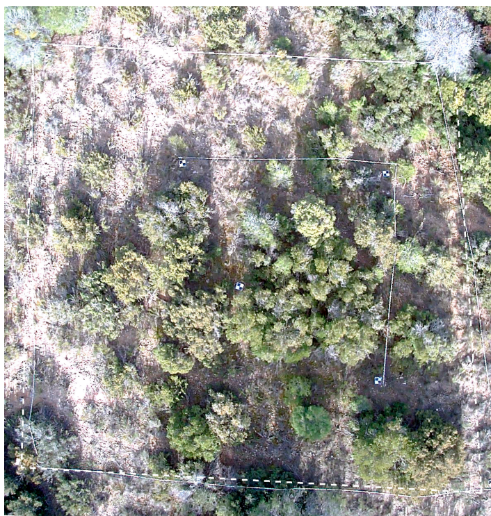
Ortofoto de la parcela